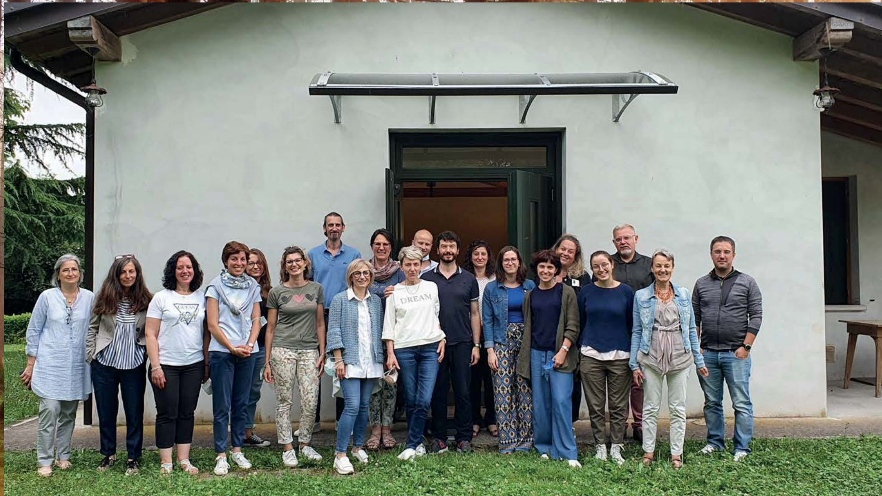
Il gruppo di adulti in formazione presso il santuario di Madonna di Strada (Fanna)